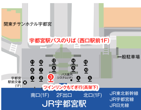
JR宇都宮駅西口バスターミナル ③番のりば