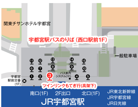
JR宇都宮駅西口バスターミナル ③番のりば